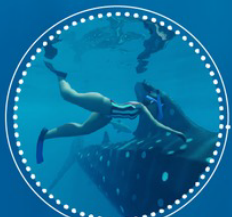
CONTACTO CON NADADORES